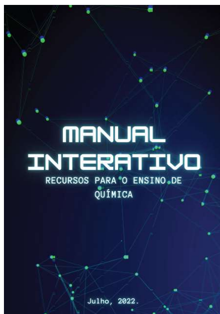
Figura 1. Capa do manual

links direcionados para sites de download e vídeos tutoriais de utilização. A navegação é facilitada com simples cliques sobre a imagem (Figuras 1 e 2).