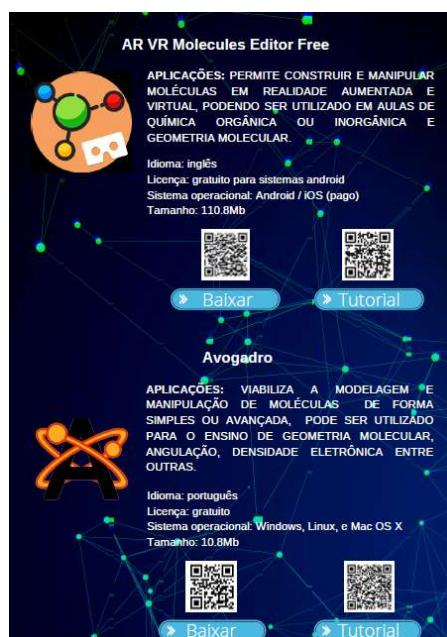
Figura 2. Parte do manual interativo com dois softwares .